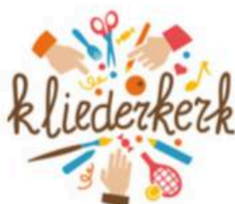
13 - Dagelijks brood