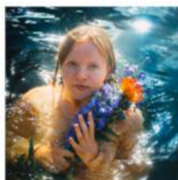
17 - Huiskamerconcert