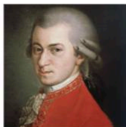
7 - Mozart's Requiem