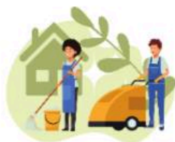
4 - Poetsrondje kerk