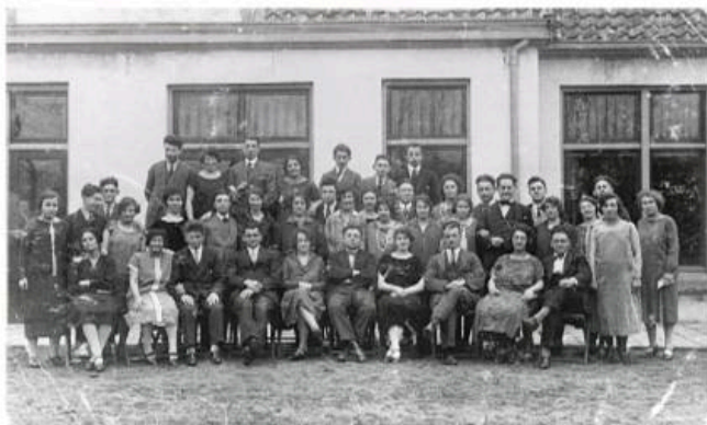
De leden van de Joodse Toneelvereniging 'Ons Genoegen' bij het 25-jarig bestaan van de vereniging in 1930

Sinds 2016 verzorgt de Werkgroep Leren van de oorlog in samenwerking met de Stichting Winterswijkse Synagoge voor vertellingen in Winterswijk. Dit jaar zijn er op zondag 26 april van 11.00 uur tot 16.00 uur zes verschillende verhalen te beluisteren en mee te beleven.