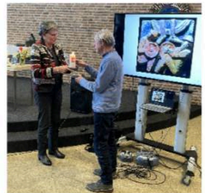
Overdracht van de kaars aan de volgende groep