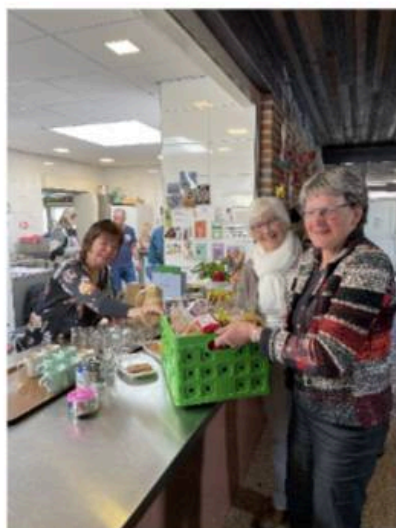
Overdracht van de krat met koekjes aan de dienstdoende barvrijwilliger

Deze kaars blijft branden zolang het Kerkasiel zal duren.