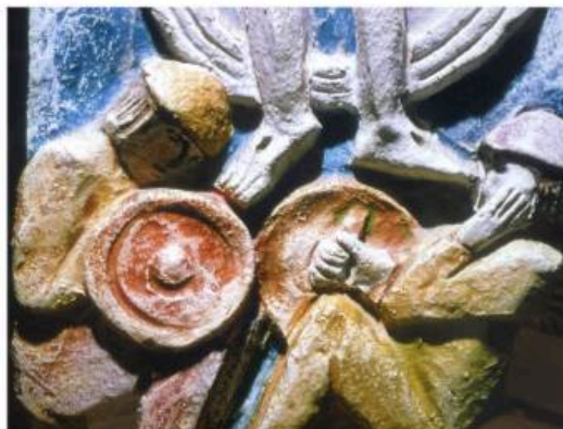
De laatste statie: Jezus verrijst uit het graf