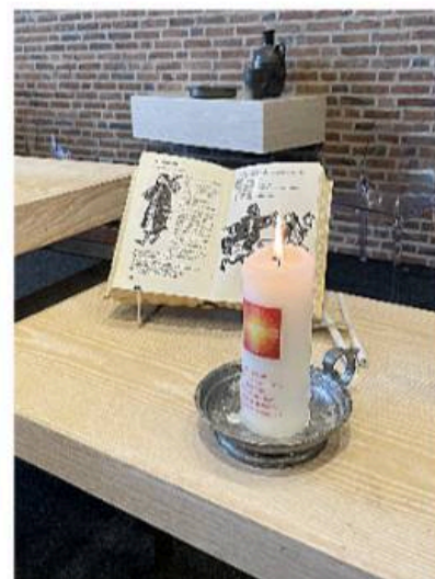
De kaars blijft branden gedurende de periode van dit kerkasiel